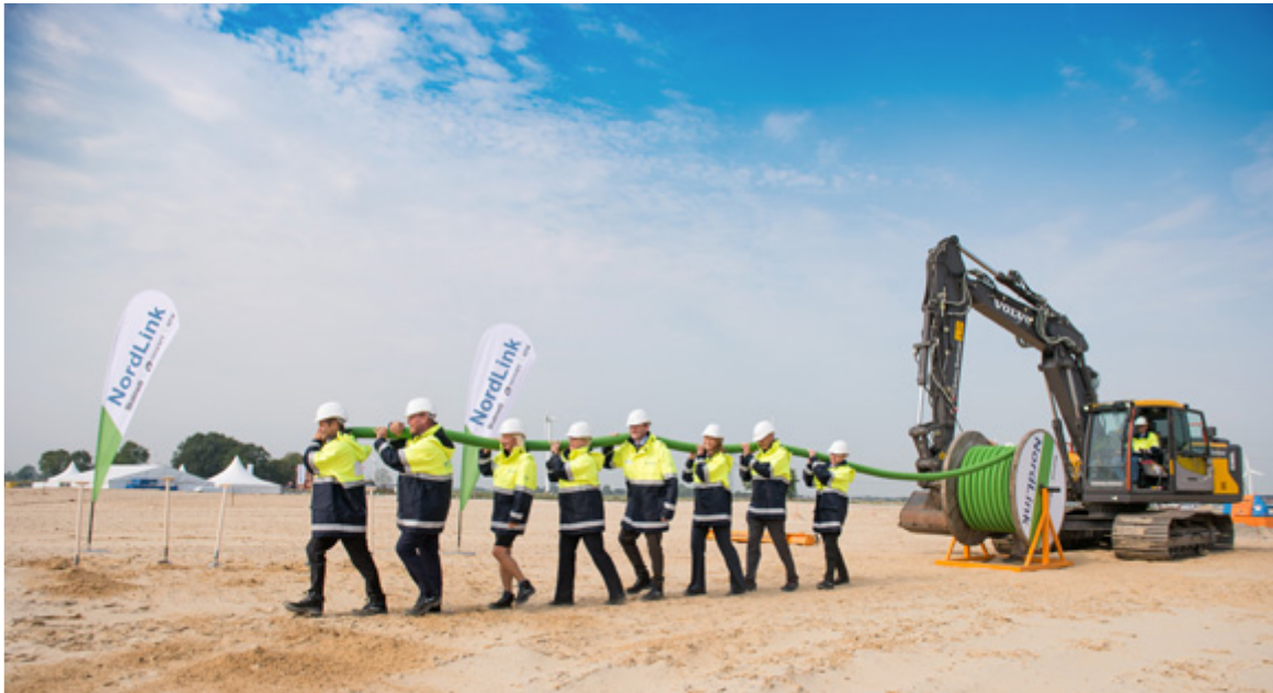
Erster Spatenstich und symbolischer Kabelzug für NordLink.

Deutschland und Norwegen rücken näher zusammen: Im Projekt „NordLink“ verbinden mehr als 600 Kilometer Seekabel erstmals die Strommärkte beider Länder. Der erste Spatenstich ist gesetzt.