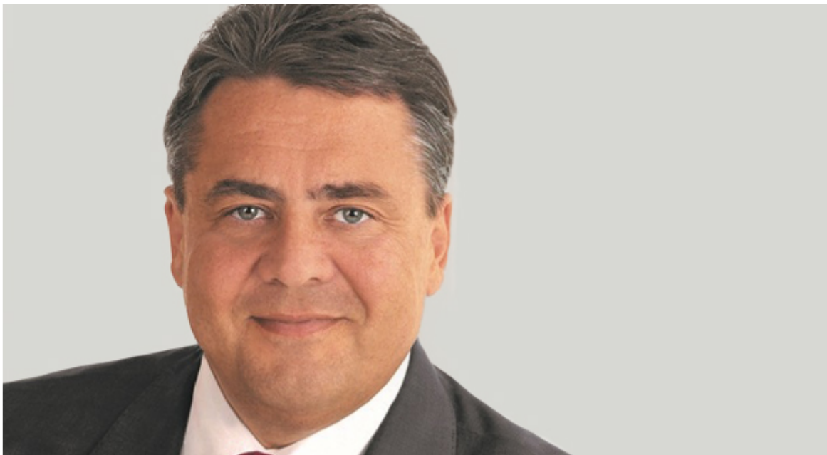
Sigmar Gabriel, Bundesminister für Wirtschaft und Energie

„Keine Energiewende ohne Windenergie. Mir ist wichtig, dass wir die gewachsenen industriellen Strukturen der Windwirtschaft erhalten können. Deswegen geben wir eine klare Perspektive für Ausbaumengen an Land und auf See.“